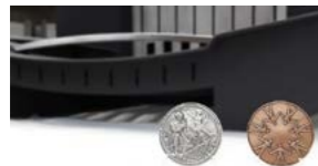
L'insert-ouvert décoré au Concours Lépine 2015 !